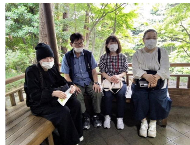
地域生活支援センタープラッツ スタッフ一同

皆さん大自然に身を置き、パワーを頂いたようで、すがすがしい笑顔が印象的な行事となりました。今後も、季節を感じられるような外出のプログラムが実施していけたら良いなと思っています。