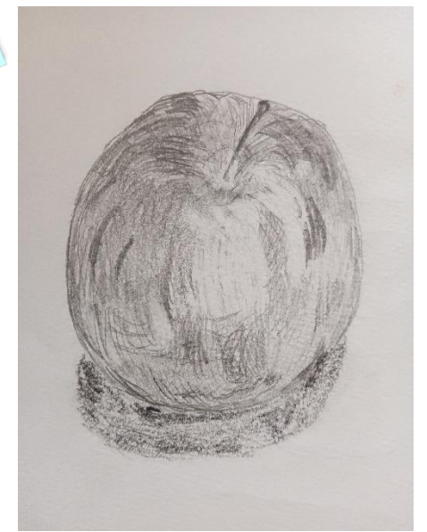
「リンゴ」 NEVER GIVE UP